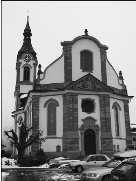
Außenansicht einer katholischen ...